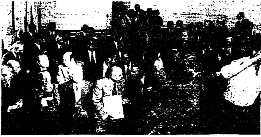
لقطة عامة للجلسة